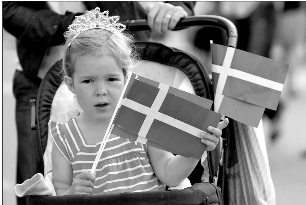
Bald könnten alle Neugeborenen in Schweden schwedische Staatsbürger sein.

Auch die Doppelstaatsbürgerschaft will man nicht einführen: „Österreich vertritt den Standpunkt, dass nur eine Staatsbürgerschaft